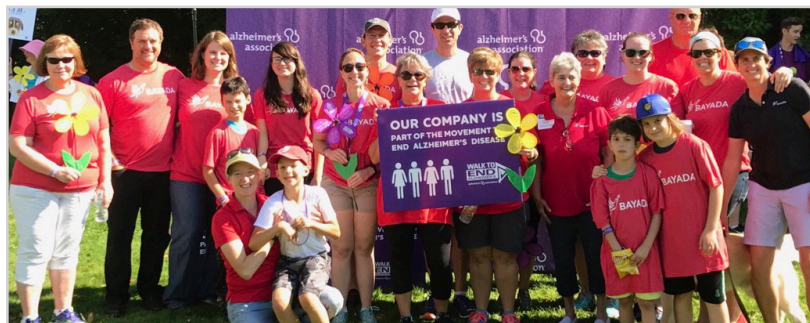
El equipo de BAYADA 2017 de Upper Valley, VT